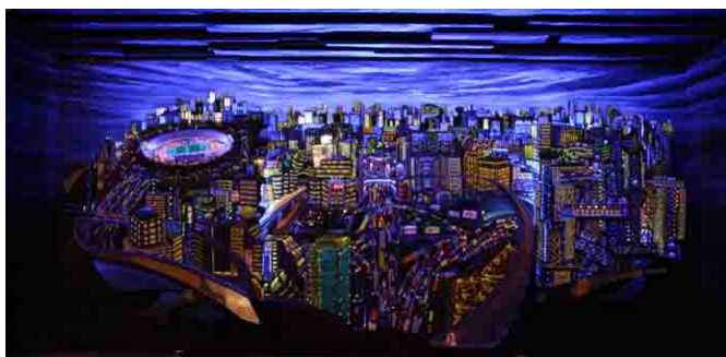
Franco Angelosante: Metropolis ; acrilici fluorescenti, legno, lampada di Wood e led - cm 155 x 360 - anno 1988

In mostra si propone un pendant di oli su tavola recuperato nel corso dell'indagine; dipinti di straordinario contenuto evocativo che si consideravano ormai perduti.